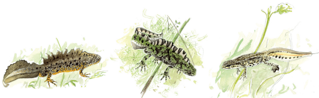
▲ Triton crêté

Les eaux calmes et peu profondes du Marais poitevin (mares, étangs, prairies humides...) sont des pouponnières idéales pour les 5 espèces d'urodèles et les 12 espèces d'anoures. Malgré cela, toutes les espèces sont en déclin.