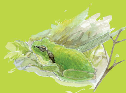
▲ Rainette méridionale

Les rainettes peuvent grimper partout grâce aux petites ventouses qu'elles ont au bout des doigts. Entre mars et juin, elles affectionnent les eaux stagnantes végétalisées pour s'accoupler. Originaires du sud de la France, la Rainette méridionale colonise naturellement le Marais.