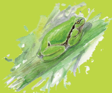
▲ Rainette verte

◀ La Salamandre tachetée se reproduit sur terre, en juin-juillet. Après une gestation de quelques mois, la femelle dépose plusieurs dizaines de larves dans l'eau, entre janvier et février. Elle vit dans le bocage de bordure de la vallée du Lay et dans la forêt de Mervent.