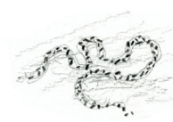
Ponte de crapaud