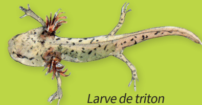
Larve de triton

L'adulte respire par ses poumons à l'air libre mais aussi par sa peau quand il est sous l'eau. Cette membrane très fine et riche en vaisseaux sanguins, permet à l'oxygène dissous dans l'eau de passer dans le sang.