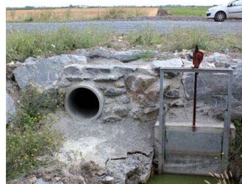
Passage à loutres

Ce document se décline en 48 fiches actions qui précisent les orientations et les moyens pour atteindre les objectifs de conservation et de valorisation des milieux naturels et des espèces d'intérêt européen pour lesquels le site Natura 2000 a été désigné. Ces fiches actions encouragent des activités humaines telles que l'élevage extensif, la pédagogie à l'environnement et l'entretien du réseau hydraulique tertiaire.