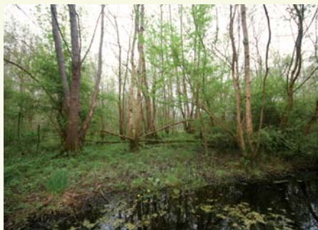
Aulnaie-frênaie d'intérêt prioritaire