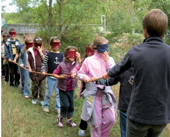
Animation auprès de scolaires