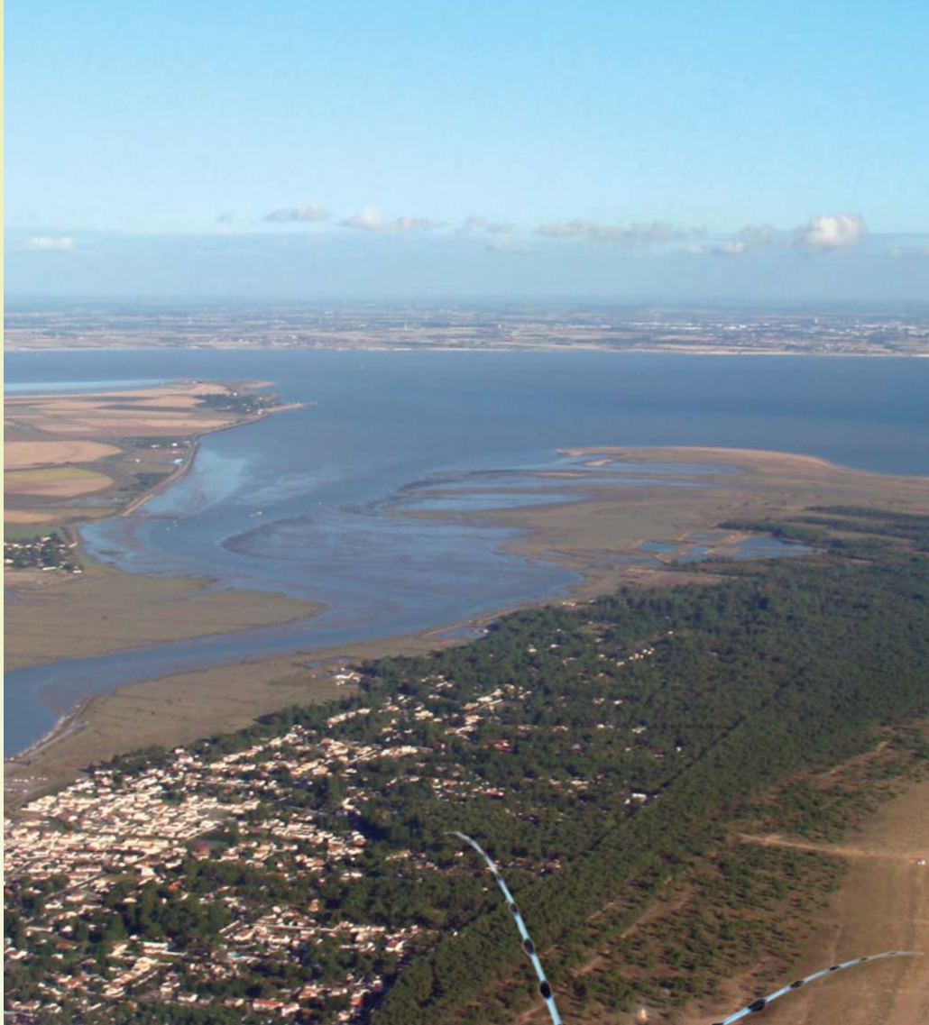
Les pointes sableuses d'Arçay et de l'Aiguillon

Les milieux naturels d'intérêt communautaire recensés sur notre territoire sont par exemple : les prairies saumâtres de l'ouest, les frênaies humides des marais mouillés, les nombreux canaux et fossés, le cordon dunaire et la baie de l'Aiguillon.