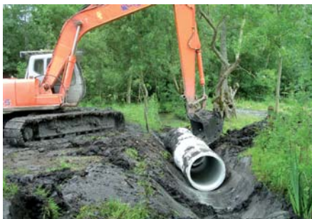
Curage de fossé et pose de buse

Après 7 années d'animation, un programme LIFE Nature de 2004 à 2008, le temps est à l'évaluation et à la révision du document. 2011 annonce une nouvelle phase de concertation à laquelle les acteurs du territoire seront conviés pour une participation active à l'écriture de cette deuxième version du document d'objectifs.