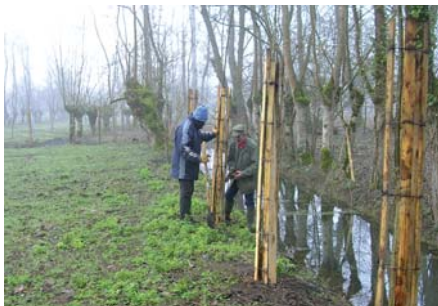
Plantation de frênes

Outre la promotion de l'outil "Charte Natura 2000" en direction des propriétaires, la dynamique de contractualisation en faveur d'actions de restauration ou de gestion, semble bien engagée.