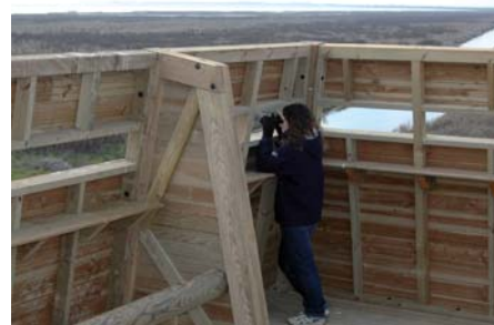
Suivis en baie de L'Aiguillon