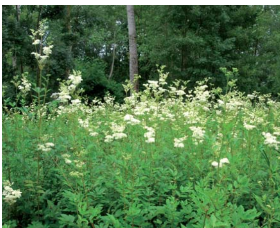
Mégaphorbiaie à Reines des prés