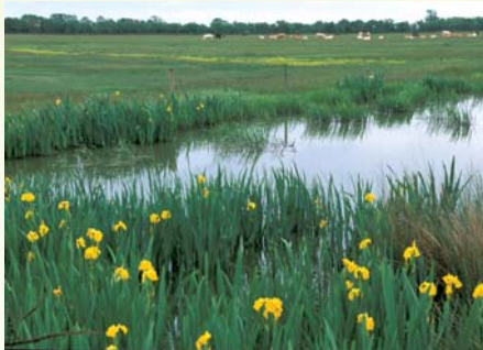
Prairies saumâtres et canaux