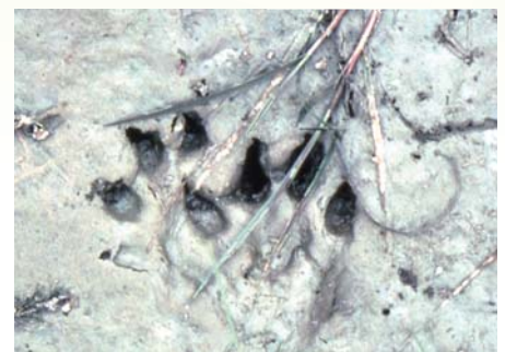
Empreintes de Loutre