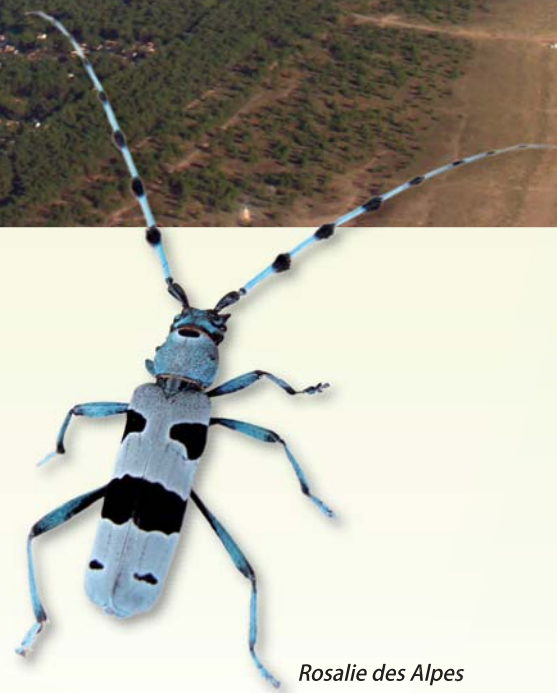
Rosalie des Alpes

Parmi les espèces d'intérêt européen caractéristiques du Marais poitevin, on compte : La Loutre d'Europe, la Rosalie des alpes, le Cuivré des marais ou encore une fougère aquatique à quatre feuilles, la Marsilée.